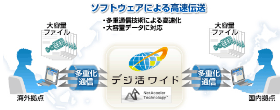
グローバル高速データ転送システムのイメージ