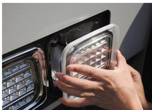
取り付けイメージ